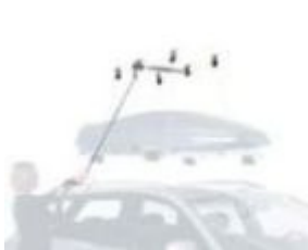
Thule Boxlift 571

A Thule Spirit 820 tetőboxhoz az alábbi kiegészítő termékeket ajánljuk: