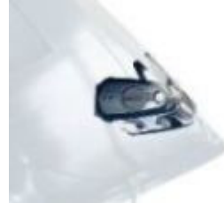
Thule Clamp Lamp

A legjobb megoldás a tetőbox karbantartására a Thule Boxtisztító használata. Környezetbarát ápoló- és tisztítószer, mely megóvja tetőboxát a káros környezeti hatásoktól, és melynek segítségével tetőboxa megőrzi eredeti fényét.